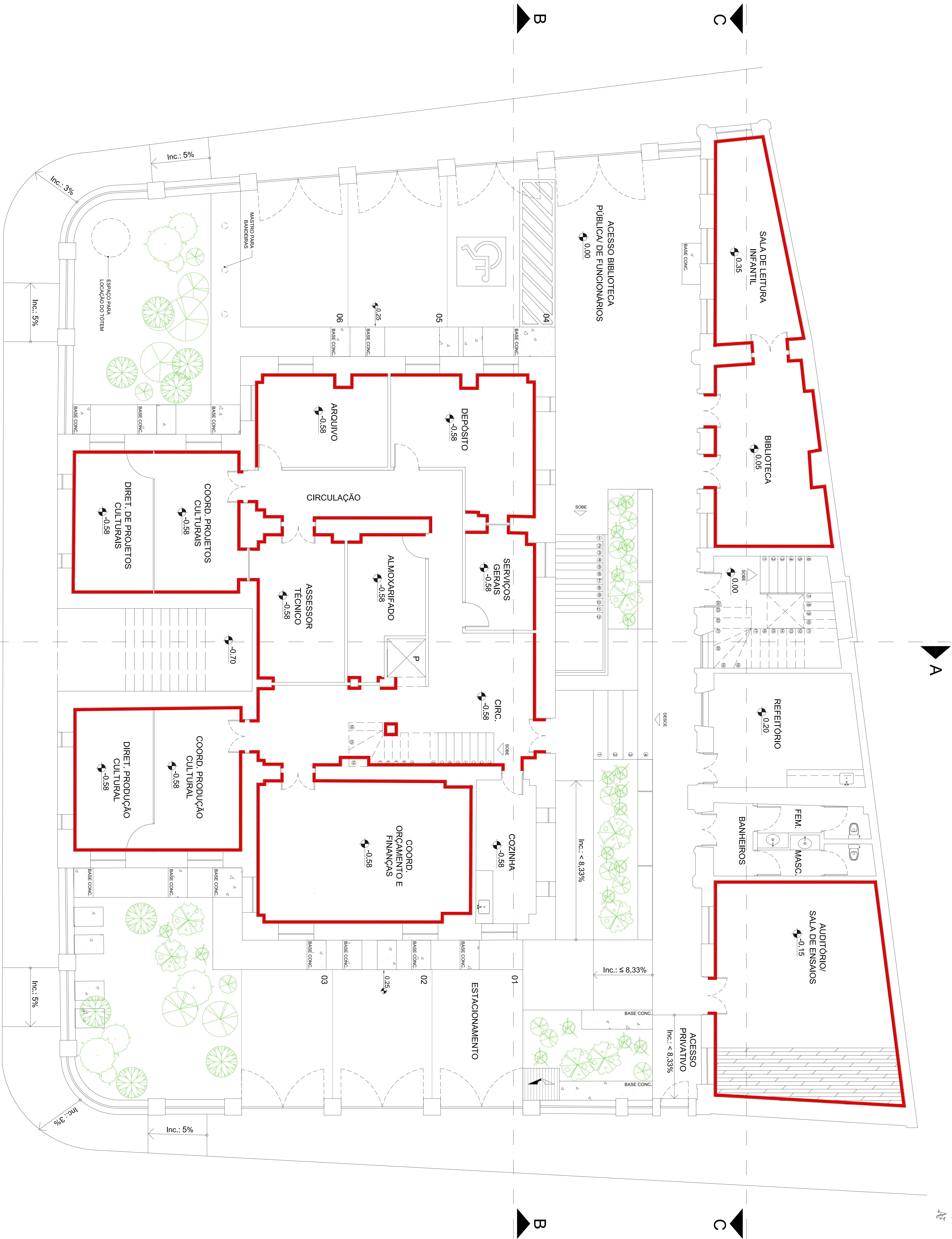
PLANTA BAIXA - PAV. TÉRREO ESCALA 1/50