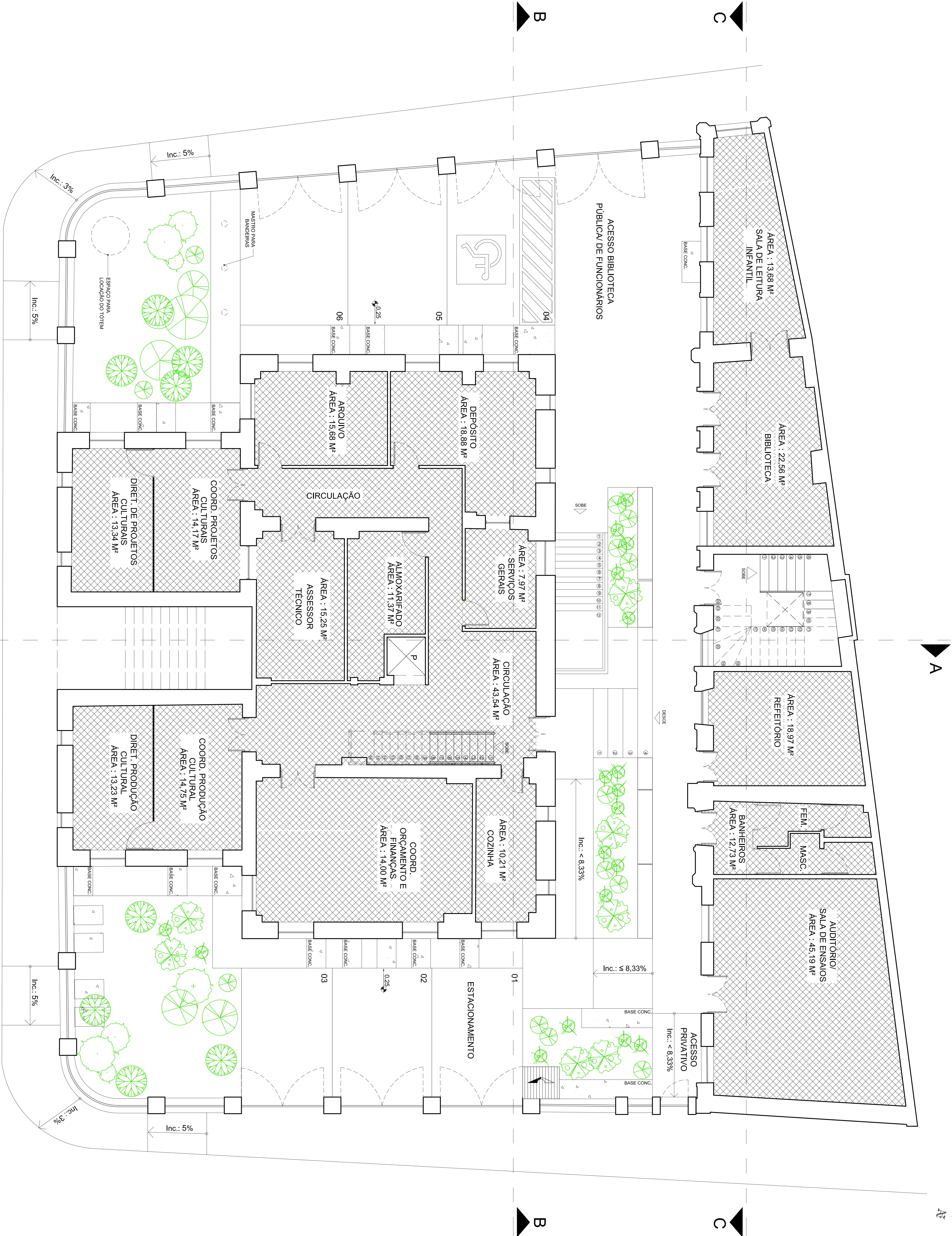
PLANTA BAIXA - PAV. TÉRREO