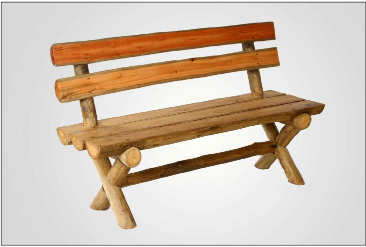
Modelo Banco de madeira certificada