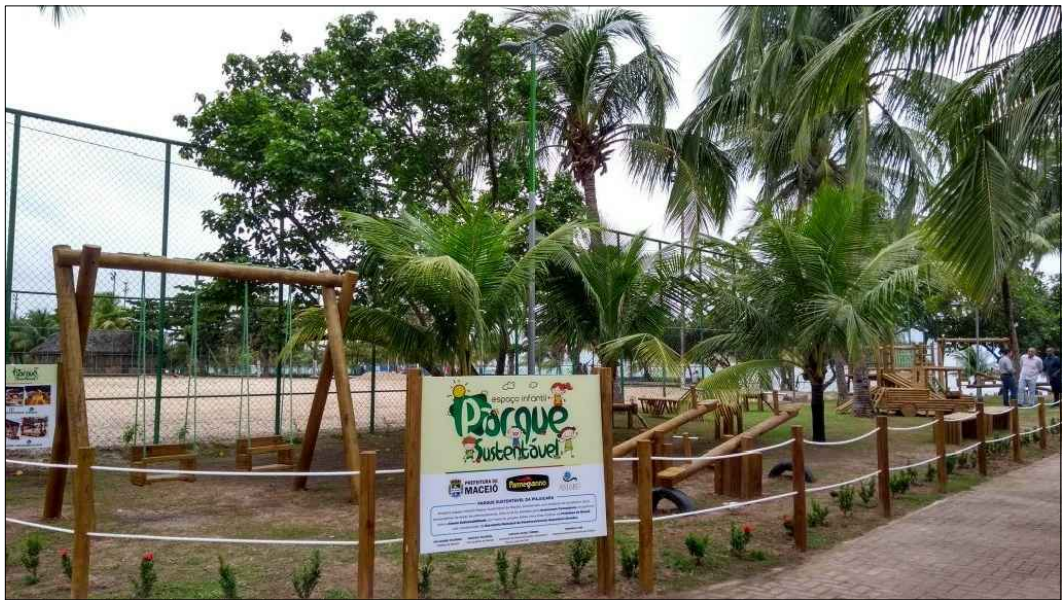
Modelo cerca em madeira certificada