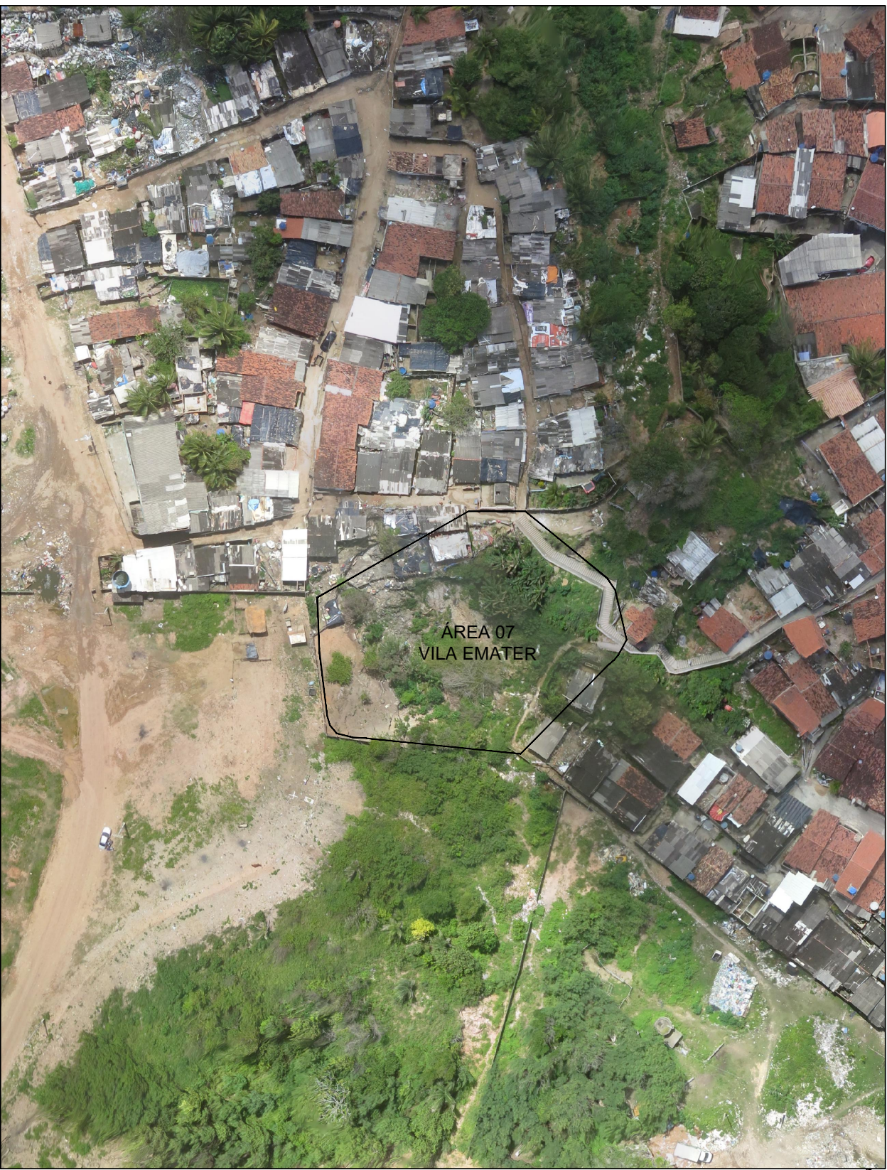
PLANTA DE SITUAÇÃO SEM ESC.