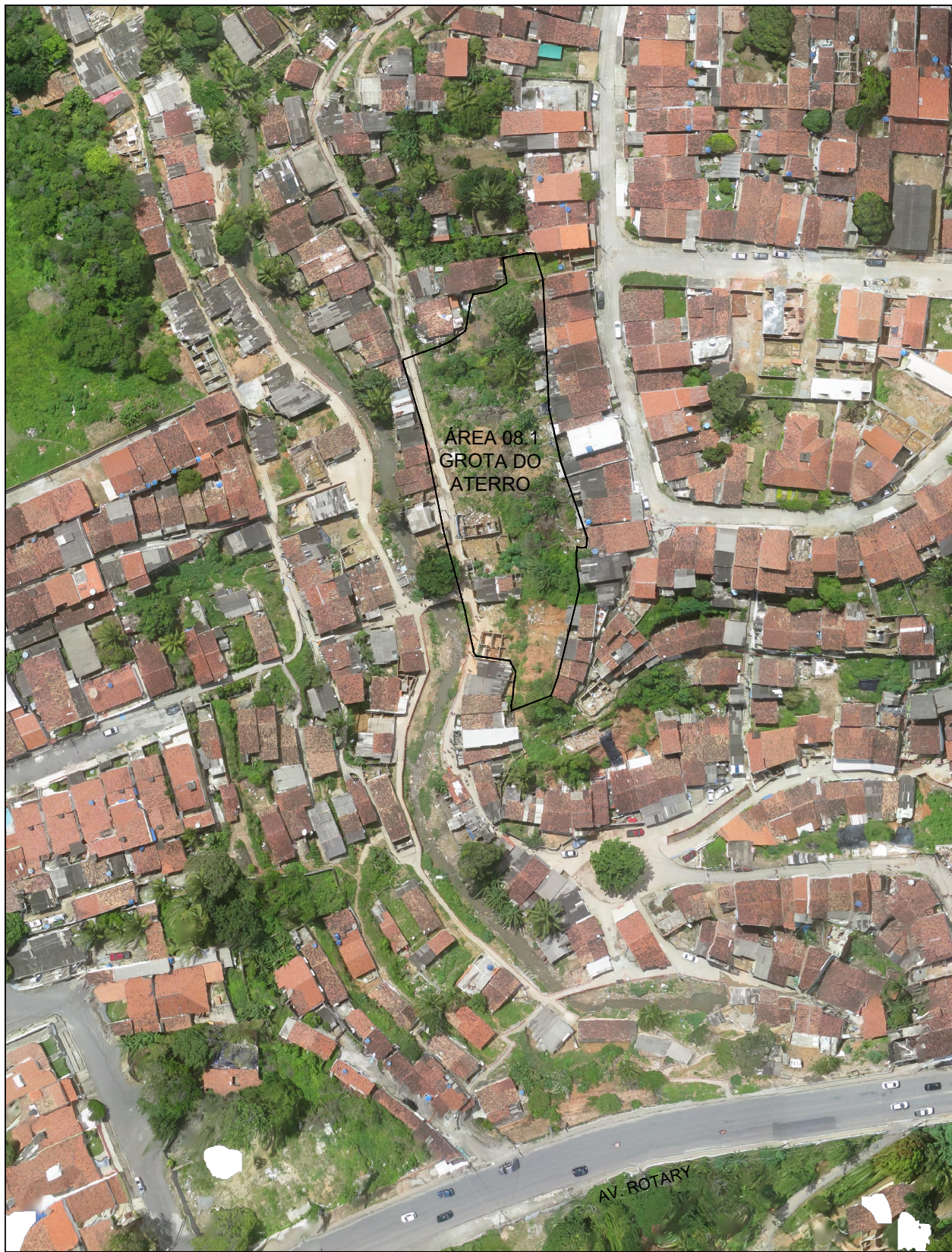
PLANTA DE SITUAÇÃO SEM ESC.