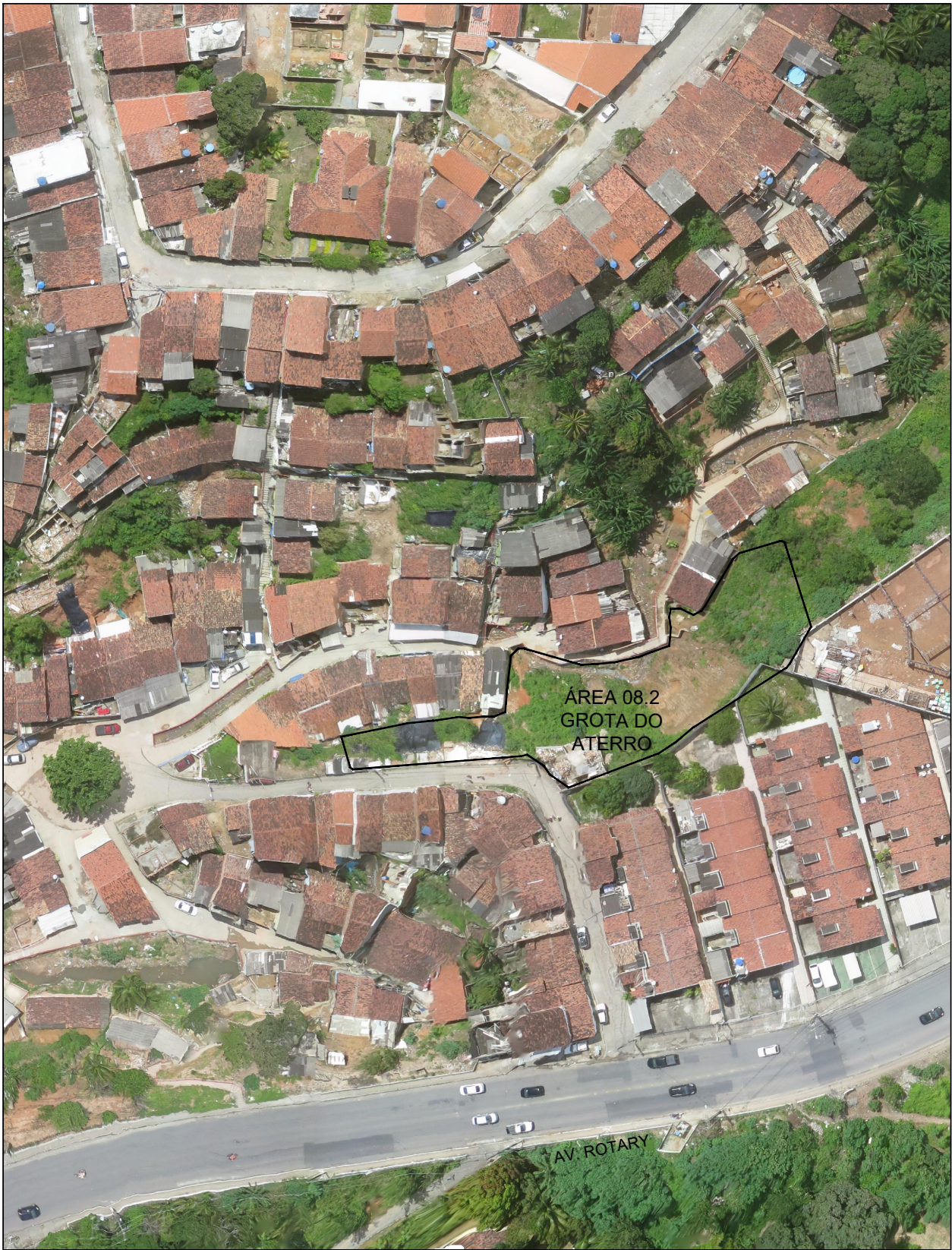
PLANTA DE SITUAÇÃO SEM ESC.