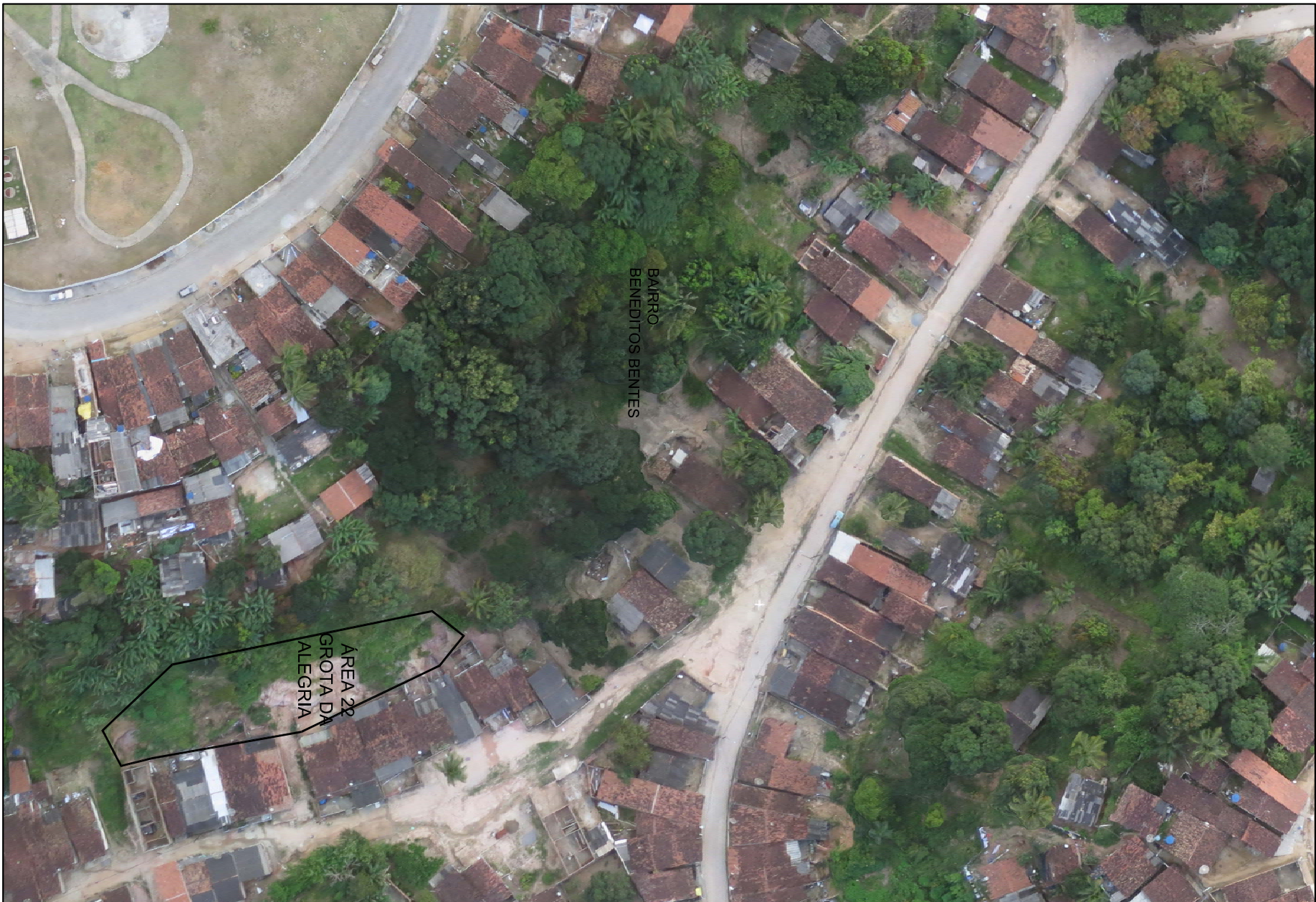
PLANTA DE SITUAÇÃO SEM ESC.