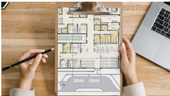
Figura 2 - arquivo Canva