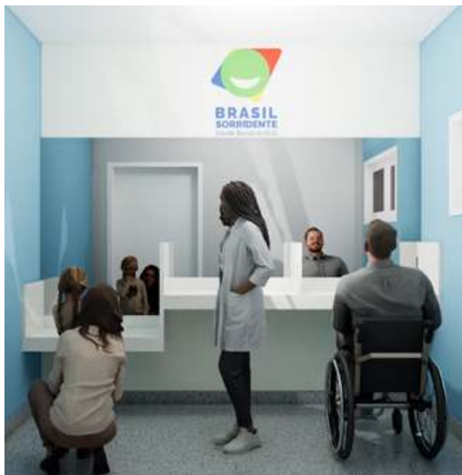
Figura 9 - Recepção

2. Acessibilidade: Deverá ser respeitada a necessidade de plataforma e/ou elevadores e depender da legislação local e da forma como se pretende verticalizar. Nos casos de terrenos com grande declividade, onde se pretende a adoção de desníveis, os mesmos cuidados devem ser adotados através de rampas e/ou plataformas seguindo as recomendações das normas técnicas vigentes.