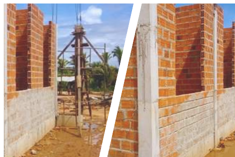
Figura 12- Arquivo Canva - Sistema convencional de Obra

Além disso deverá validar novamente o Plano de Segurança Contra Incêndio e Pânico - PSCIP com profissional engenheiro habilitado. De forma geral todas as vedações internas da edificação já foram previstas como sistema leve (drywall), respeitando as necessárias resistências à umidade.