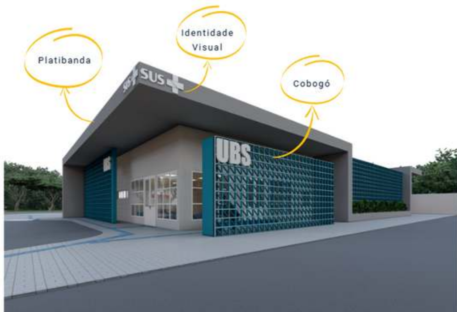
Figura 4- imagem ilustrativa Ministério da Saúde - Perspectiva UBS

Então a orientação é para manter a concepção das fachadas, porém com possibilidade de adaptação em situações excepcionais, contanto que ocorra de maneira pontual levando-se em consideração os cuidados acima mencionados.