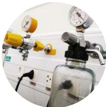
Figura 18