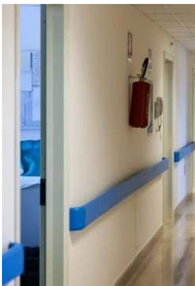
Figura 15

Já para as áreas molhadas o projeto de referência traz como opção o revestimento cerâmico branco, com dimensão de 60cm x 60cm, borda retificada, superfície polida ou acetinada. Aplicado com argamassa industrializada ACI, com rejuntamento de 1mm a 5mm, conforme especificado pelo fabricante.