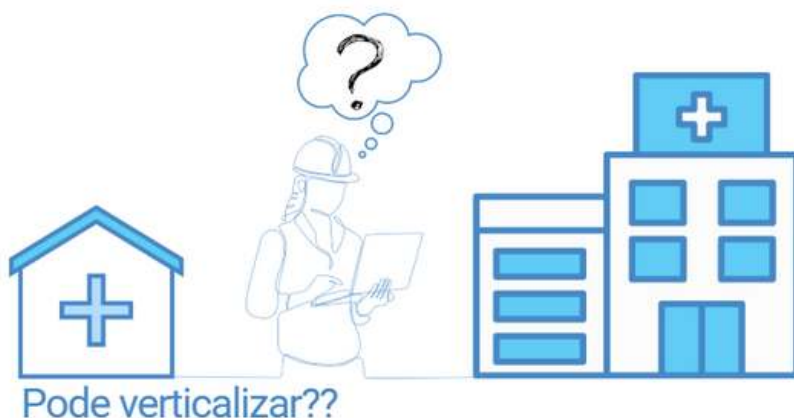
Figura 8

A verticalização pode ser uma necessidade de entes que não dispõe de terreno público na devida localização com as dimensões mínimas recomendadas para a implantação do projeto referencial. Caso estritamente necessária, a verticalização da planta poderá ser considerada. É importante, porém, ressaltar outros desafios que surgem a partir desta decisão: