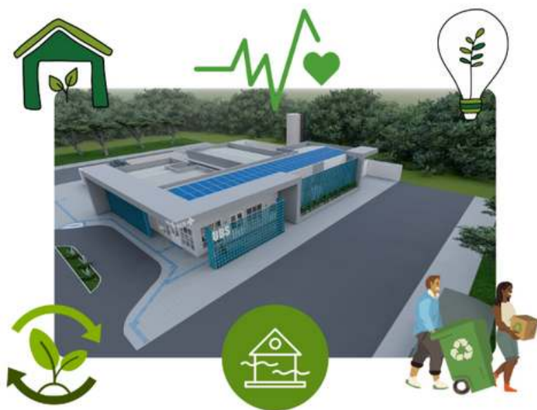
Figura 22- Arquivo Canva