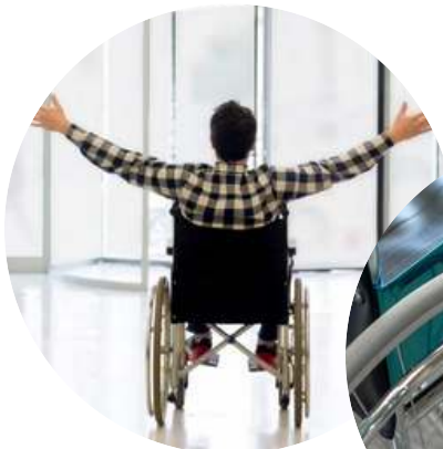
Figura 19- Arquivo Canva