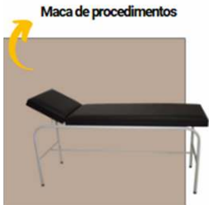
Figura 5 - arquivo Canva