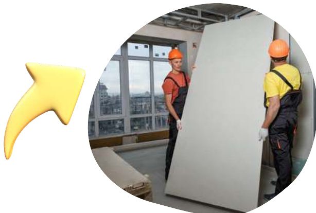
Figura 13- Divisórias interna (drywall)

Caso opte por outra solução leve deve-se garantir a capacidade do sistema de suportar as cargas dos equipamentos fixos (com ajuda de reforços ou não). Os abrigos externos (resíduos, cilindros, compressores e bombas) não podem ser executados em outros sistemas que não alvenaria tradicional em blocos.