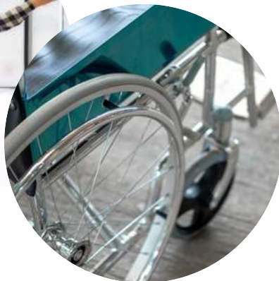
Figura 20- Arquivo Canva

Para os deficientes visuais o projeto referencial disponibilizado contempla piso tátil direcional e de alerta na área externa da edificação até as suas entradas principais. Cabe ao ente elaborar projeto de acessibilidade prevendo piso tátil nas áreas internas da edificação em conformidade com a norma ABNT NBR 9050:2020, que estabelece parâmetros gerais para instalação de pisos táteis, e a NBR 16537:2024 Acessibilidade - Sinalização tátil no piso - Diretrizes para elaboração de projetos e instalação, que determina os critérios para a elaboração de projetos e instalação de pisos táteis. Além do piso tátil, o ente também deverá elaborar projeto e providenciar a instalação do mapa tátil e das placas de sinalizações para as pessoas com deficiência visual.