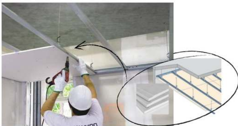
Figura 16- Teto ilustrativo

Para os ambientes internos da UBS, o material especificado para o teto foi o forro de gesso acartonado com espessura 12,5 mm. Em painéis pré-fabricados e produzidos a partir da gipsita natural e cartão duplex. Fixados em perfis de chapas de aço galvanizado, espaçados a cada 60 cm, sustentados por pendurais próprios reguláveis e fixados à estrutura existente.