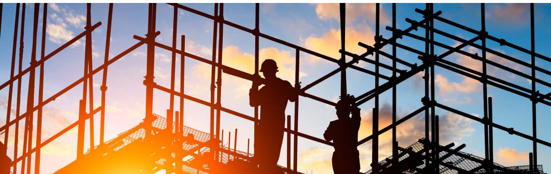
Figura 10

As premissas de construção são o conjunto de especificações técnicas que, juntas definem o modelo construtivo e viabilizam a estimativa de custos da construção através de uma planilha orçamentária. Sua alteração é permitida com ressalvas , pois algumas especificações estão intrinsicamente ligadas às premissas de utilização do projeto, além de respeitar aos critérios das normas sanitárias.