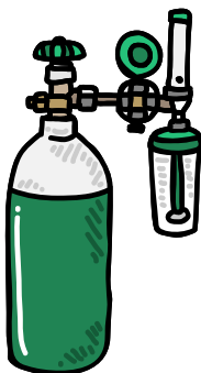
Figura 17

O projeto adota o sistema centralizado de abastecimento por questões de segurança (figura 16), enquanto o sistema descentralizado com cilindros transportáveis é reservado para emergências ou uso eventual (figura 15).