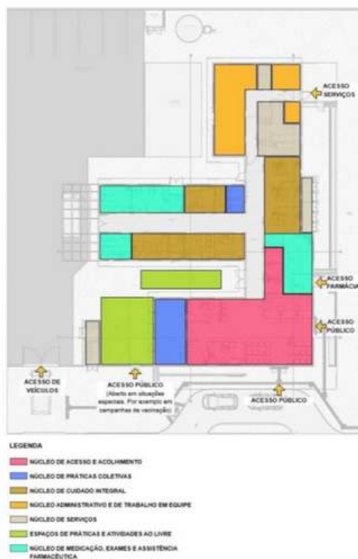
Figura 3 - Ministério da Saúde - Zoneamento UBS