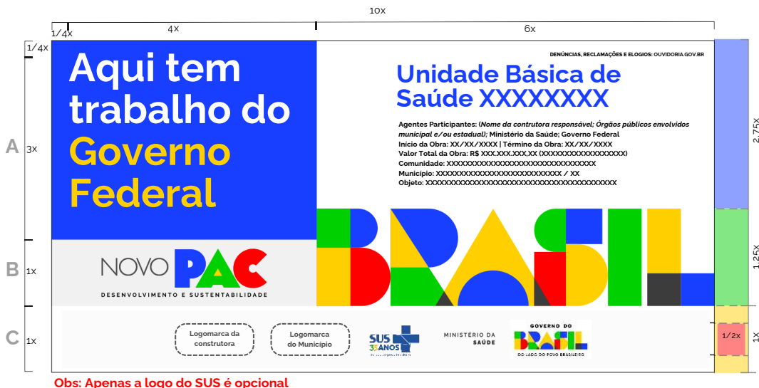
Figura 21- Arquivo Casa Civil

As placas deverão ser confeccionadas de acordo com cores, medidas, proporções e demais orientações contidas no Manual de Uso da Marca do Governo Federal – Obras, podendo ser acessado no APT Manual Novas Placas Obras_VS03 disponível em: https://www.gov.br/casacivil/pt-br/novopac/baixe-aqui-o-manual-de-uso-da-marca-do-novo-pac . As placas deverão ser fabricadas em chapas planas, metálicas, galvanizadas, ou de madeira compensada impermeabilizada, em material resistente às intempéries. Deverão ser afixadas em local visível, preferencialmente no acesso principal do empreendimento ou voltadas para a via que favoreça a melhor visualização. As informações deverão estar em material plástico (poliestireno), para fixação ou adesivação nas placas. A orientação de preenchimento dos agentes envolvidos e das logomarcas deve ser a seguinte: