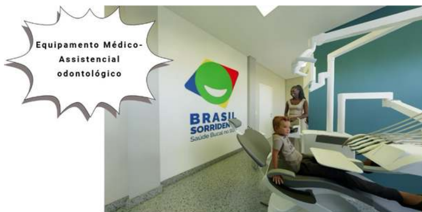
Figura 7 - Arquivo Canva - Equipamentos de Apoio

Desta forma a orientação é que o ente se atente ainda na etapa subsequente, no caso a Etapa de Execução e Conclusão de Obra, sobre a modalidade de aquisição dos equipamentos e mobiliários da UBS, afim de compatibilizar a aquisição e logística de entrega dos itens dentro do momento oportuno para a instalação.