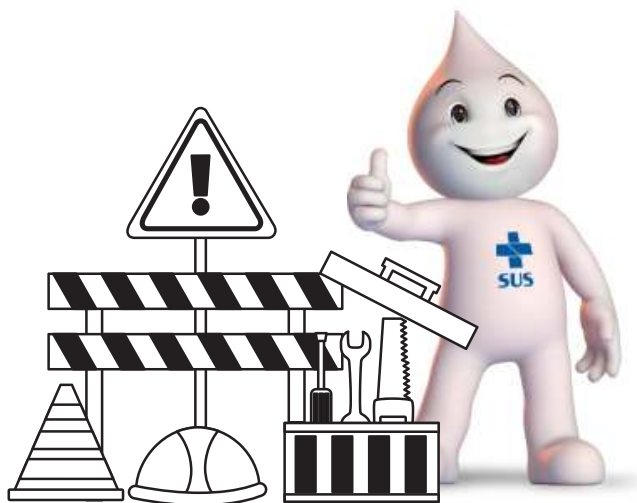
Figura 11 - Ministério da Saúde Adaptado

As premissas de construção são o conjunto de especificações técnicas que, juntas definem o modelo construtivo e viabilizam a estimativa de custos da construção através de uma planilha orçamentária. Sua alteração é permitida com ressalvas , pois algumas especificações estão intrinsicamente ligadas às premissas de utilização do projeto, além de respeitar aos critérios das normas sanitárias.