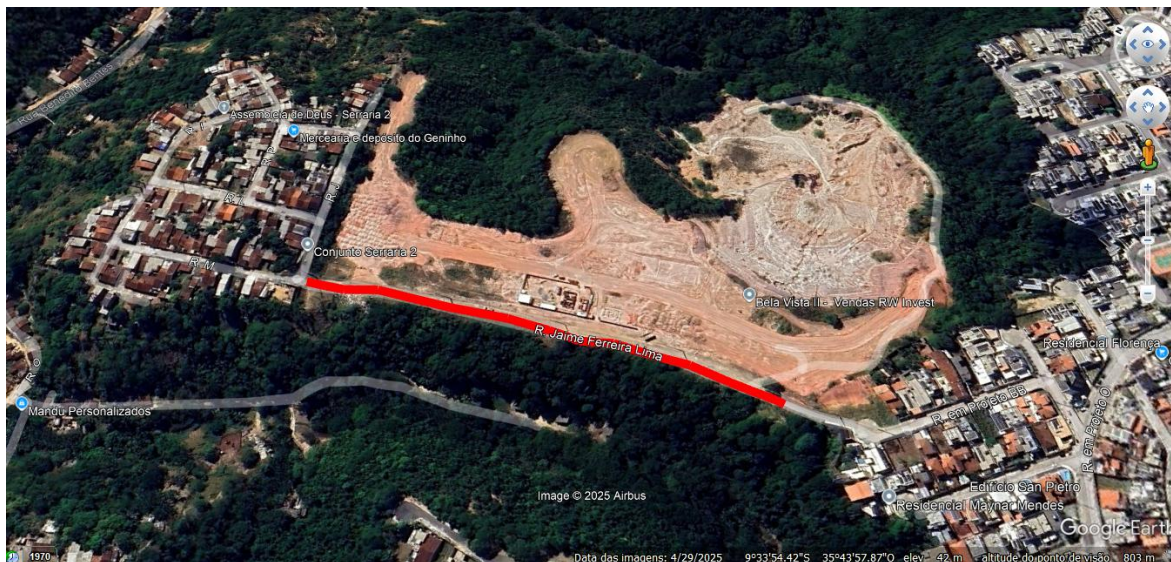
Figura 02: Localização da Intervenção.

As obras ocorrerão na Rua Jaime Ferreira Lima, no bairro Antares, nesta capital. A localização (marcada em vermelho), pode ser visualizada na imagem abaixo.