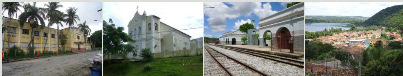
Imagens do bairro de Fernão Velho. Acervo: DPHC. SEMPLA.2012.

(...) “as cidades podem ser comparadas a uma espécie de arquivo de pedra formado por documentos que traduzem em sua materialidade existências, guardando-as e transmitindo-as como fato da informação da história e da cultura.” (CASCO, 2001, p. 96).