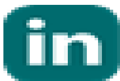
image004.png 1 KB