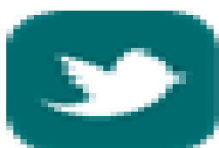
image005.png 1 KB