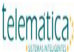
image001.jpg 3 KB