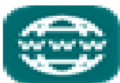
image002.png 2 KB