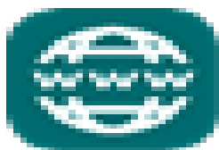
image002.png 2 KB